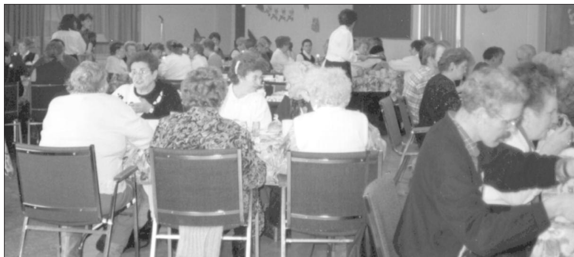
Le dîner de l'amitié offert 2 mardis par mois.

Ce service vous permet de combler certains besoins en alimentation tout en faisant des économies intéressantes dans votre budget.