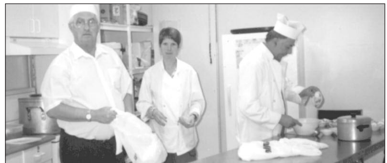
La Popote roulante.