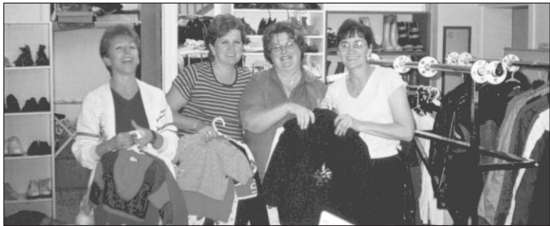
Le comptoir de vêtements usagés.

Vous avez le goût de consacrer du temps, de partager vos connaissances et votre expérience afin d'améliorer la qualité de vie de plusieurs personnes de notre communauté? Joignez-vous à notre équipe de bénévoles.